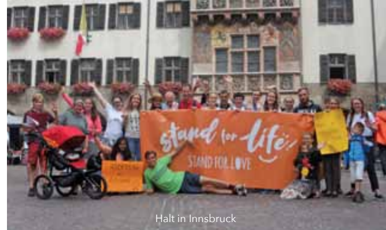
Halt in Innsbruck