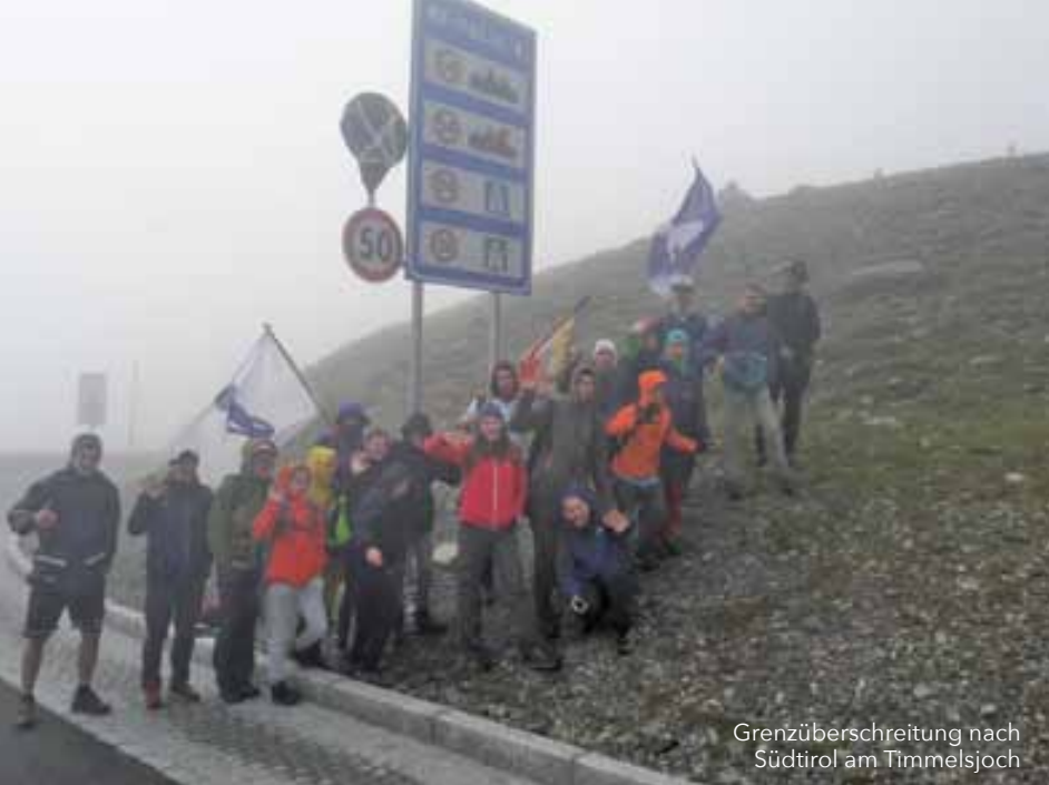
Grenzüberschreitung nach Südtirol am Timmelsjoch