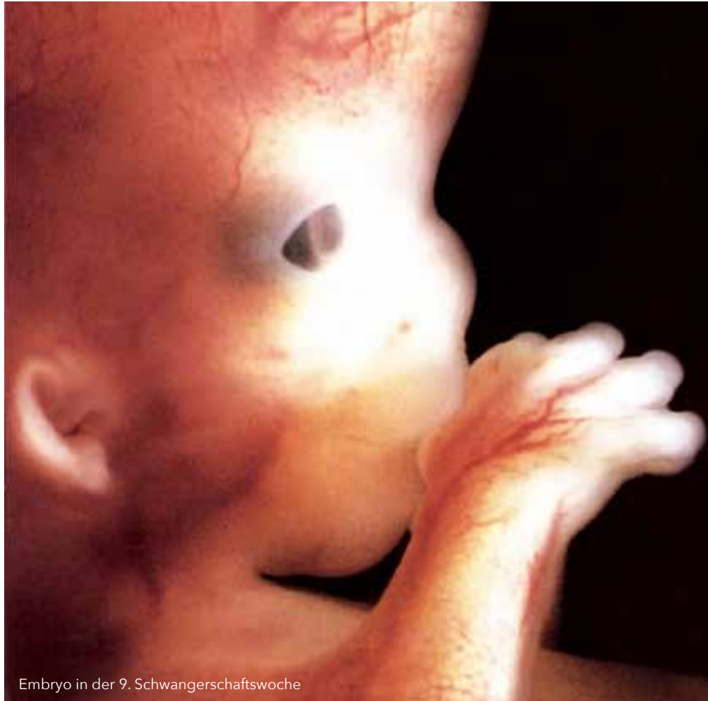
Embryo in der 9. Schwangerschaftswoche

Diese Erklärung stellt den menschlichen Embryo in ein neues Licht, denn er wird klar und deutlich als „Person“ erklärt; bereits mehrmals haben die Wissenschaftler des Comitato Nazionale di Bioetica den Embryo als ‚menschliches Individuum‘ bezeichnet. Freilich hat sich das Kassationsgericht nicht weiter aus dem Fenster gewagt, obwohl es der biologischen Logik hätte folgen müssen, wo doch klar sein muss, dass der Fötus (Embryo) nicht nur am «Beginn der Wehen» als „Person“ bezeichnet werden kann, sondern bereits seit der Empfängnis, da es sich dabei um ein und dasselbe Subjekt handelt, das sich biologisch entwickelt und Frucht der Verschmelzung der Ei- und