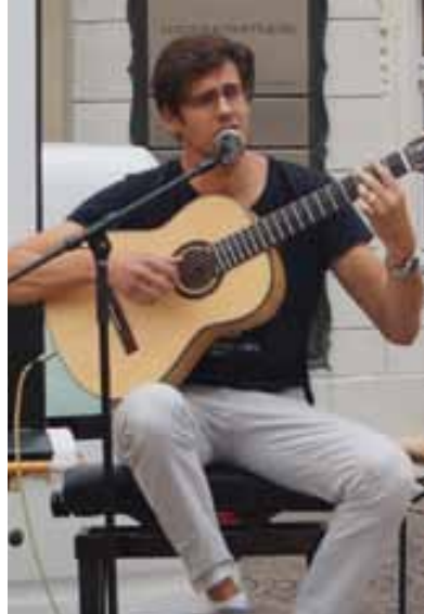
↑ Der Musiker und Filmproduzent Gustavo Brinholi