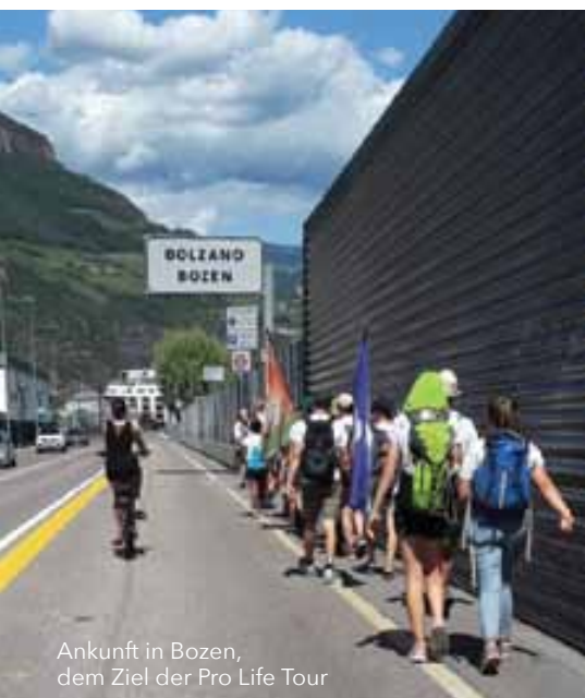
Ankunft in Bozen, dem Ziel der Pro Life Tour

darum geht es bei der Pro Life Tour. Das Erleben der Gemeinschaft. Das Wissen um die Gleichgesinnten, die mit den gleichen Hemmungen auf Fremde zugehen und mutig ihre Hemmungen überwinden. Warum? Weil wir nicht tatenlos zusehen können, während hunderttausende Kinder jedes Jahr in unseren Ländern abgetrieben werden. Weil wir unseren Beitrag leisten wollen für eine Gesellschaft ohne Abtreibungen. Weil wir gerufen sind, um für jene zu sprechen, die keine Stimme haben. Darum waren wir unterwegs. Und darum werden wir auch weitergehen. Solange es eben nötig ist!