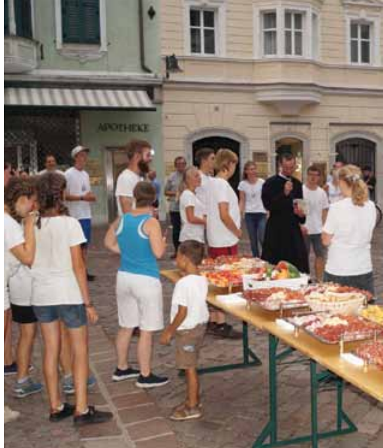
↑ Am Ende der Abschlussveranstaltung gab es für alle ein leckeres Buffet.